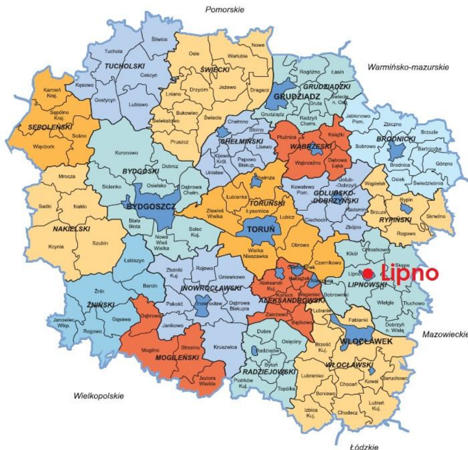
Położenie miasta; podział administracyjny województwa kujawsko-pomorskiego.